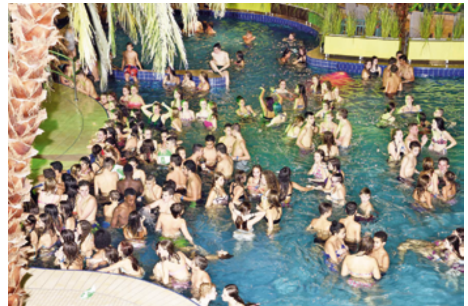
In drei Areas chillen, tanzen und baden die Besucher bei der Macht-Alarm Poolparty.

In den letzten Jahren begeisterte eine Tanz-Area im Freizeitbecken mit Showbühne und DJ, Aqua-Zumba-Aktion sowie einer Break-Dance-Einlage. Dagegen ging's in der Aktiv-Zone in einer sehr jugendorientierten Art sportlich zu. Messen konnte sich hier nicht, wer der beste Schwimmer ist, sondern wer die beste Arschbombe macht oder das schnellste Schlauchboot fährt. Diejenigen, die sich ins Wasser springend oder rudern ausgetobt hatten, brauchten anschließend dringend eine Erholungspause. Dafür gab es die dritte Area, den Chill-Bereich mit alkoholfreien Cocktails. Im Zentrum der Party steht schließ-