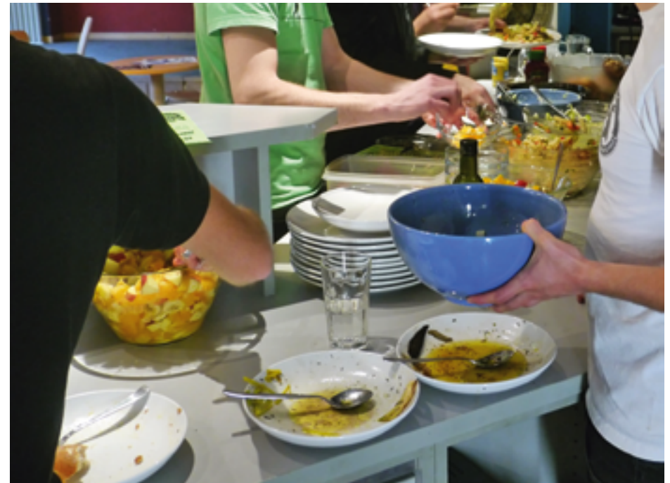
Dass gesundes Essen auch lecker sein kann, erfahren Teilnehmer an Projekten des „Gesunden Jugendzentrums“