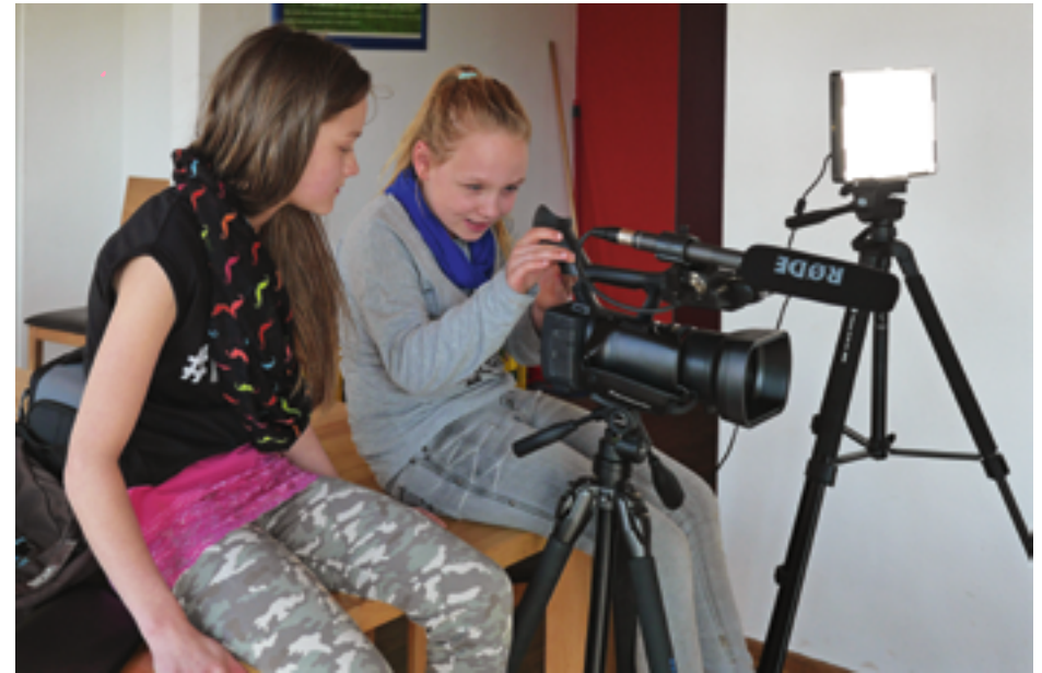
Bei Bamberg:TV können Jugendliche ihre eigenen Themen multimedial aufbereiten.

Raum für abwechslungsreiche Freizeitangebote ohne Zwang und Verpflichtungen, Platz für Austausch und für die persönliche und soziale Entwicklung von Jugendlichen sowie die Möglichkeit, Angebote und Projekte selbst aktiv mit zu gestalten – diese Grundsätze hat sich ja:ba für die tägliche Arbeit gesetzt. Nicht nur in den Jugendtreffs, sondern auch im Rahmen von übergreifenden Veranstaltungen werden diese umgesetzt und stellen so eine Bereicherung für alle Kinder und Jugendliche in Bamberg, unabhängig von deren Alter, Nationalität, Konfession oder Geschlecht dar.