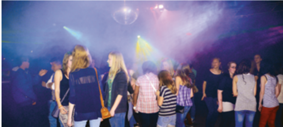
Bei den U16-Partys feiern Jugendliche ausgelassen ohne Alkohol und Tabak.

Themen wie Poolparty oder jugendspezifischen Veranstaltungen vorzubereiten, zu schneiden und zu vertonen. Durch das Projekt werden zum einen Integration und Inklusion von jungen Menschen gefördert, weil Jugendliche mit verschiedenen Backgrounds, gemeinsam ein Projekt umsetzen. Zum anderen setzen sich die Teilnehmer mit gesellschaftspolitischen Themen auseinander. Dadurch werden Partizipation, Teilhabe und das demokratische Handeln der Zielgruppe gefördert. Schließlich können die Mitwirkenden neben Medienkompetenz im Bereich Schnitt,ameratechnik und Ton auch Basiskompetenzen wie Team- und Projektarbeit ausbauen.