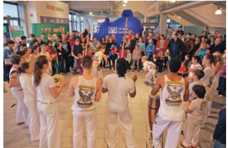
„Mach mit und probier dich aus!“ – das ist gelebtes Motto beim Bamberger Tag des Sports.

Das Modellprojekt führte auch zu einer Weiterentwicklung der ja:ba-Mitarbeiter im Bereich der gesundheitsförderlichen Jugendarbeit. Um die Erfahrungen aus dem Modellprojekt auch für andere Einrichtungen der Jugendarbeit nutzbar zu machen, entstand auch eine