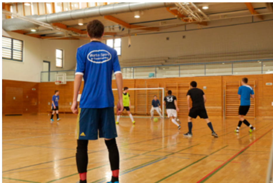
Gesunder Wettkampfgeist, gute Musik und gehillte Stimmung machen die Turniere "Heat of the Street" und "ja:ba-Cup" aus.

Internetseite 3 mit detaillierten Prozess- und Angebotsdarstellungen.