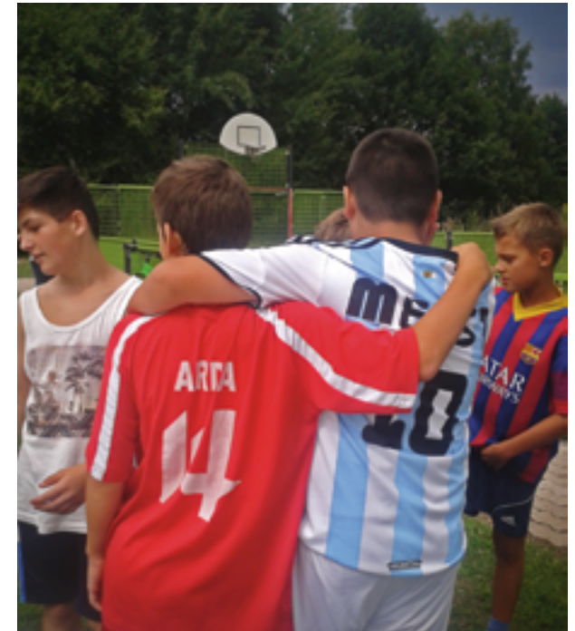
Neue Freundschaften knüpfen, Verantwortung füreinander übernehmen: dies sind gelebte Werte im JO.