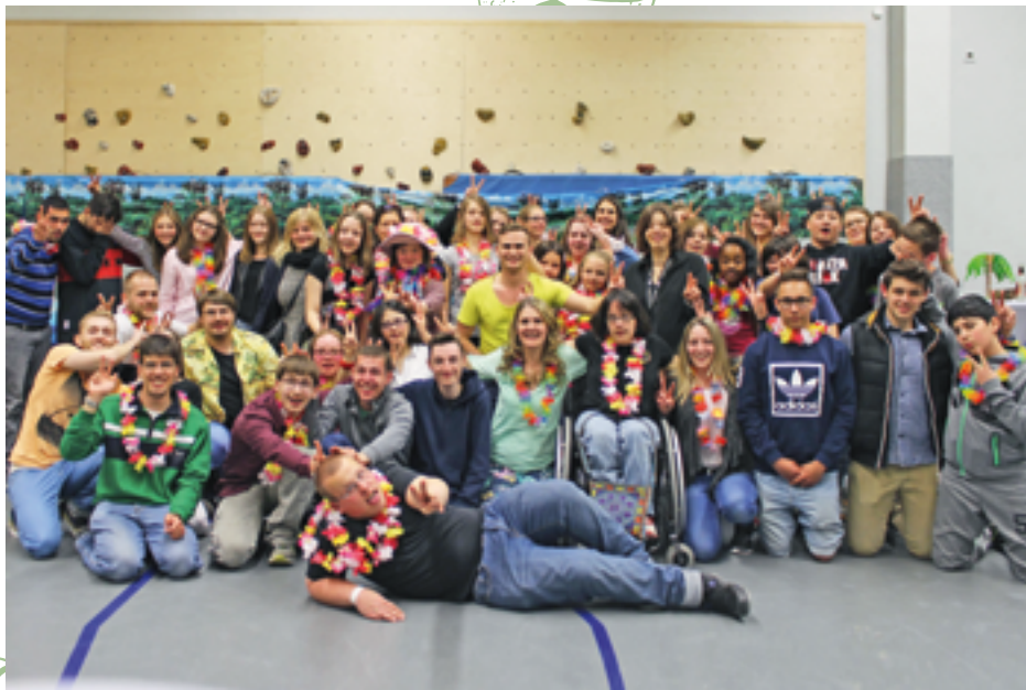
Bei der Hawaii-party konnten Jugendliche mit und ohne Hintergrund gemeinsam feiern und Hemmungen abbauen.