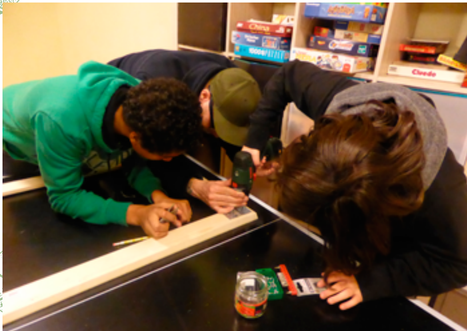
Auch im JO sind Jugendliche aktiv an der Gestaltung und Verschönerung des Treffs beteiligt.