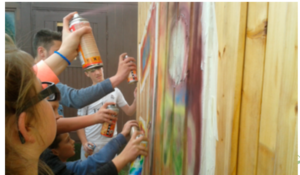
Mit Spraydosen bewaffnet wird Jugendkultur auch im Bamberger Osten gelebt.