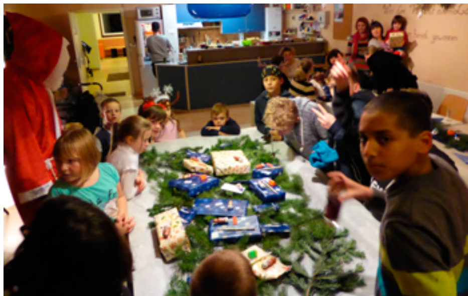
Anwohner und Flüchtlinge aus der Umgebung feiern gemeinsam im JO Weihnachten – und lernen sich dabei kennen und schätzen.

Dirt Bike-Patenschaft. Dass Aktivitäten über Fuß- und Basketball hinausgehen, zeigt auch die seit 2014 gelebte Patenschaft mit der Dirt-Bike-Gruppe des Zweiradsportler Bamberg e. V. Neben der direkten Unterstützung des jungen Vereins und seiner zum großen Teil jungen Mitglieder, finden Austauschtreffen und gemeinsam ausgestaltete Dirt-Bike-Jams statt. In Begleitung von ja:ba haben Jugendliche auch als Nicht-Vereinsmitglieder einen Zugang zum Gelände in der Nähe des Troppauplatzes und somit einen weiteren Attraktivitätspunkt im Gebiet Ost.